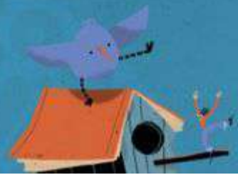
Illustrazione: Daniela Piras

Dialoga con l'autrice Giampaolo Cassitta